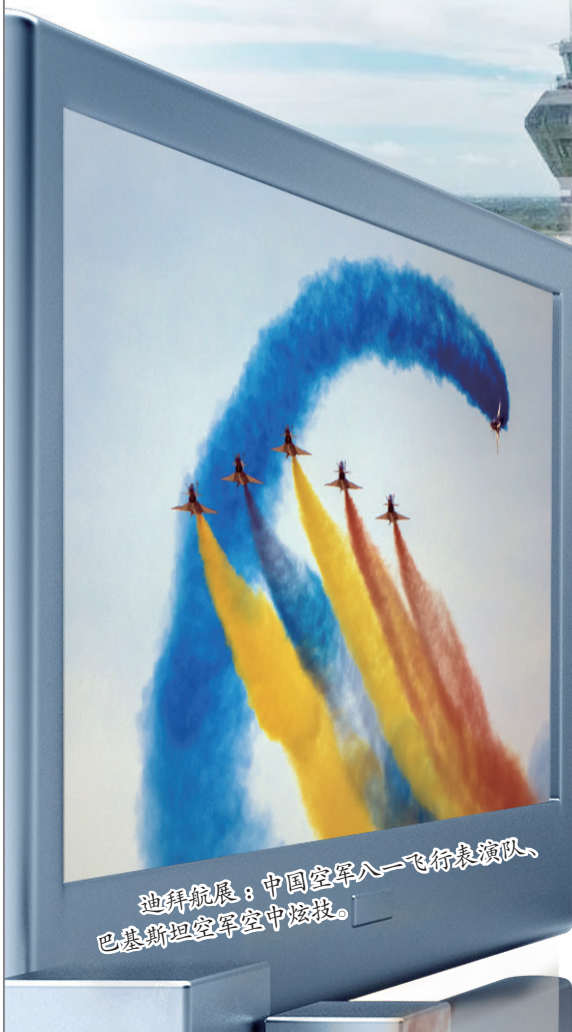
迪拜航展：中国空军八一飞行表演队、巴基斯坦空军空中特技。