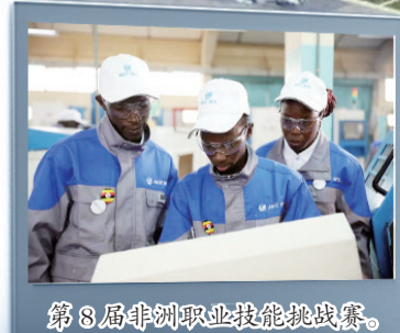
第8届非洲职业技能挑战赛。