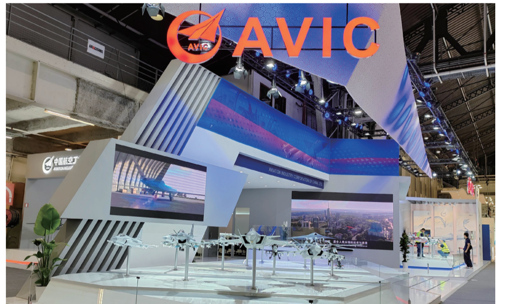
第54届巴黎航展开幕，航空工业以“携手合作，创造价值”为主题参展。

从“望尘莫及”到“各领风骚”，航空工业与多家中国企业的抱团“出海”，不仅展示了中国航空的实力，更向世界展示了交流合作的能力与意愿；从“总体跟跑”到“主体并跑”，航空工业完成了从单一产品展示向成体系展示、解决方案展示的重大转变。在不断学习、探索中，如今的航空工业已成长为