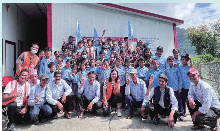
尼泊尔热索瓦公立学校恢复项目。

东风浩荡万里澄，与时偕行天地宽。面对新形势新要求，航空工业将继续在党中央的领导下，蹄疾步稳、踔厉奋发，为打造具有国际影响力的世界一流品牌、建设世界一流航空企业，提供中国方案、贡献中国力量、传递中国价值、彰显中国担当。