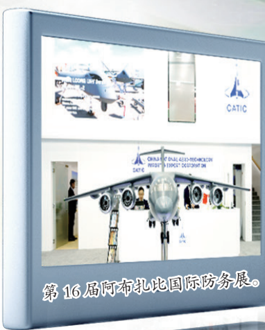
第16届阿布扎比国际防务展。