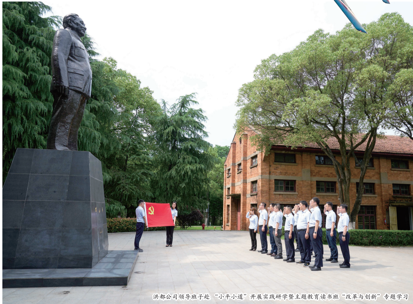
洪都公司领导班子赴“小平小道”开展实践研学暨主题教育读书班“改革与创新”专题学习