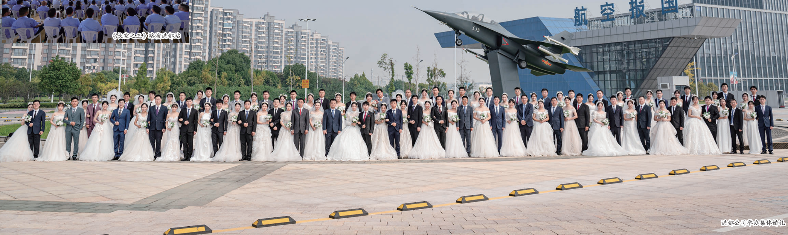
洪都公司举办集体婚礼