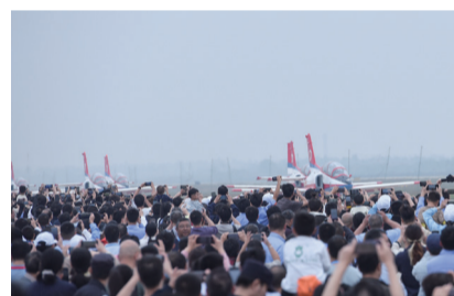
2023中国航空产业大会暨南昌飞行大会在瑶湖机场开幕