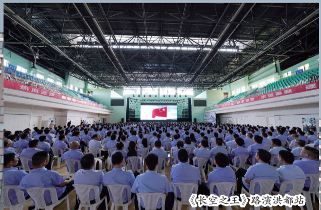
《长空之王》路演洪都站