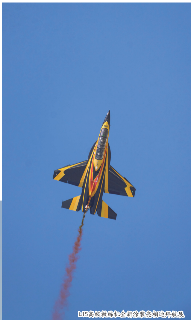
L15高级教练机全新涂装亮相迪拜航展