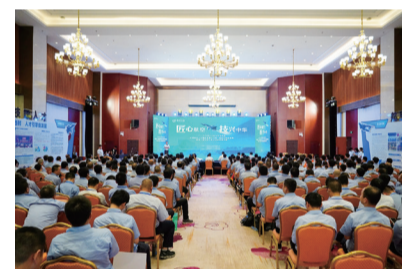
航空工业第八届职业技能竞赛暨第三届女职工职业技能竞赛在洪都举办