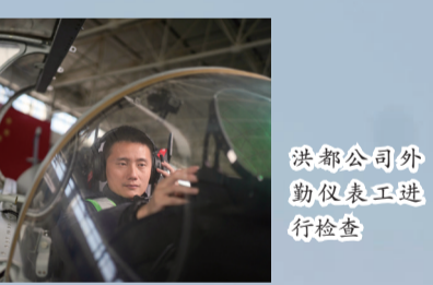
洪都公司外勤仪表工进行检查