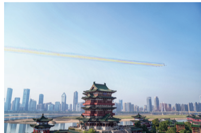
“红鹰”飞行表演队驾驶教8飞机飞越滕王阁