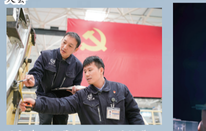
洪都公司铆装钳工和工艺技术人员进行型架检查