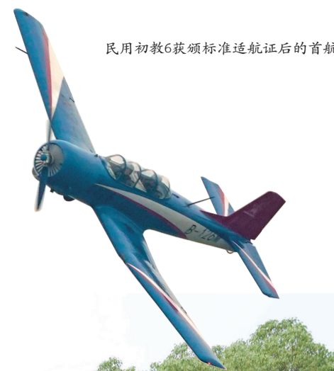
民用初教6获颁标准适航证后的首航