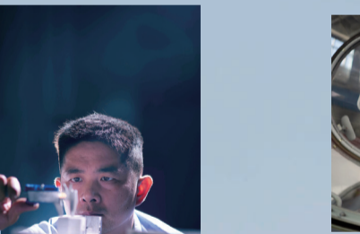
洪都公司员工聚精会神检测零件