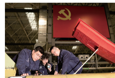
党建引领“双融双促”