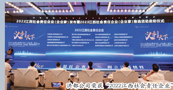
洪都公司荣获“2022江西社会责任企业”

首责高线、高质量发展主线、不发生系统性风险底线，全面推进“五大现代化”，协调推进9方面重点任务，深化一体化穿透式管理，加快航空装备建设，全力推进航空科技自立自强，为实现企业高质量发展、支撑建军一百年奋斗目标、打造世界一流高科技产业集团贡献洪都智慧与力量。