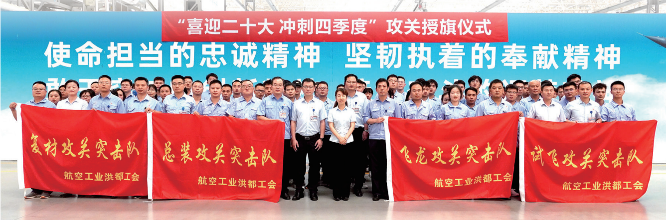
“喜迎二十大 冲刺四季度” 攻关授旗仪式 使命担当的忠诚精神 坚韧执着的奉献精神