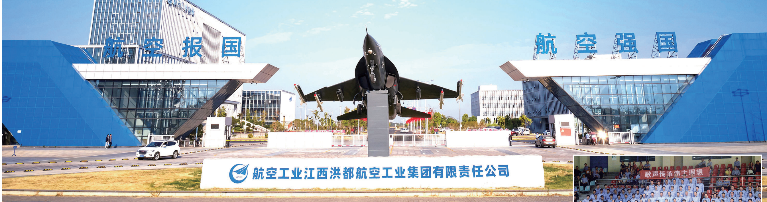
航空工业江西洪都航空工业集团有限责任公司