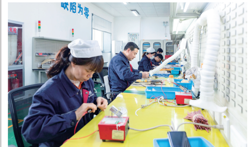
新春伊始，航空工业电源生产一线一派繁忙景象。关键和重点工序岗位党员充分发挥带头模范作用，抢时间、赶进度，以昂扬姿态赢取“开门红”。面对2023年再上新台阶的任务指标，航空工业电源号召全体党员带头开展岗位风险自查防控，提高工作质量，夯实全年任务基础。