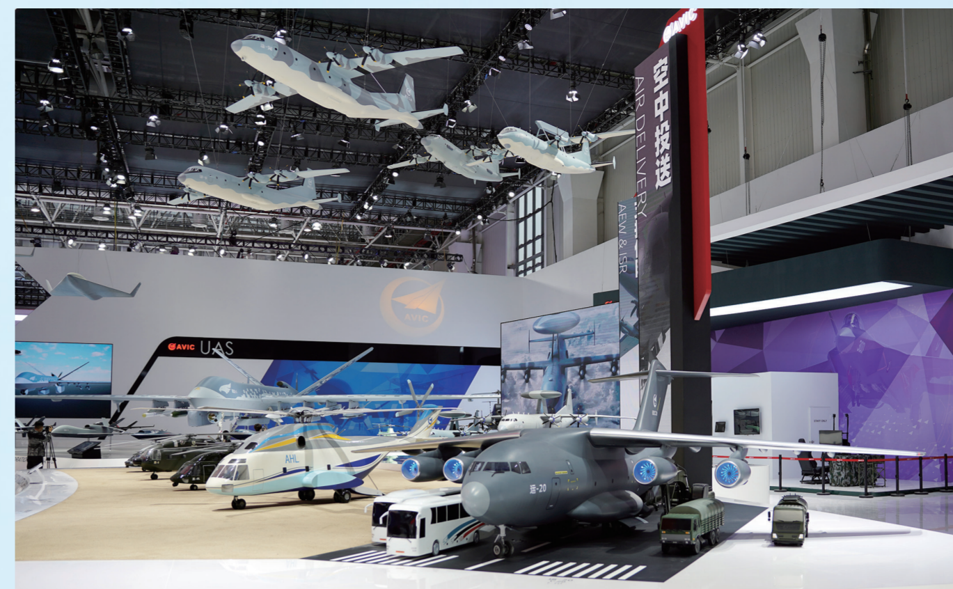
航空工业空中投展展台。