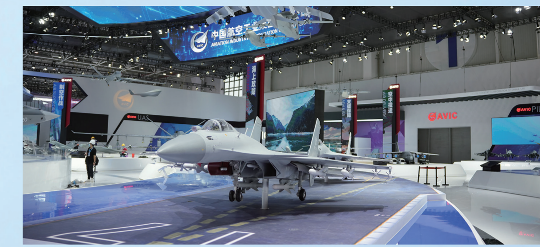
歼15舰载战斗机模型。