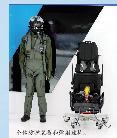
个体防护装备和弹射座椅。