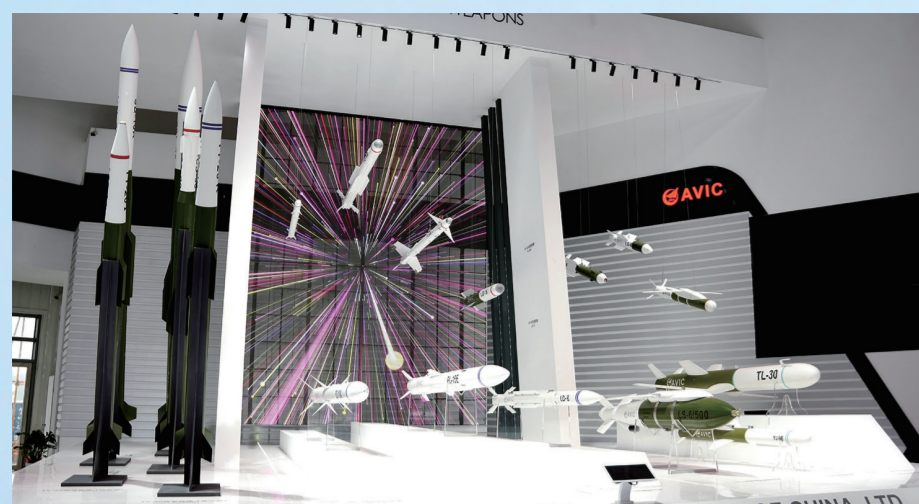
航空工业展出的空空导弹、地空导弹、空地导弹等精确制导武器。