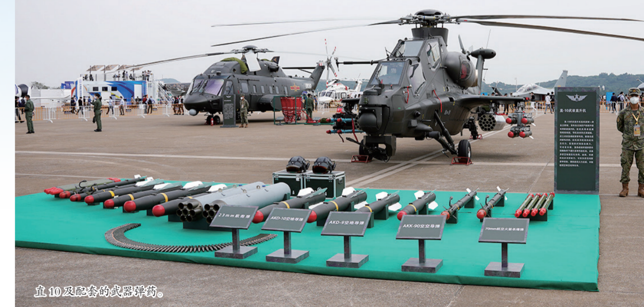
直10及配合各种型号的。