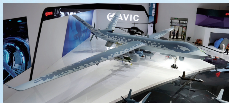
国产大型无人机“翼龙”-3首次公开亮相。