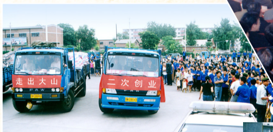
实施搬迁,走出大山。