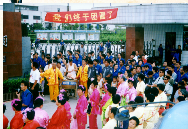
公司完成整体搬迁,在郑州实现大团圆。