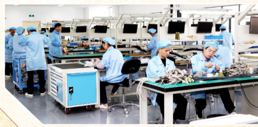
电气装配精益生产线