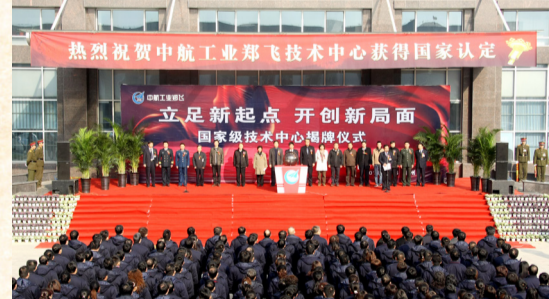
郑飞技术中心获国家认定。