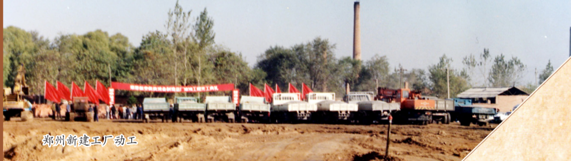
郑州新建工厂动工

20世纪80年代中后期,改革开放不断深入,市场经济快速发展,外部环境发生深刻变化。公司地处深山,发展难以为继。1987年,决定搬出大山,与郑州市建材厂合并组建军民结合型企业。面对订单骤降和举债搬迁的双重挑战,郑飞人顶住压力、逆行而上,边生产、边搬迁,抱着“就是为了子孙后代,破产也要搬到郑州”的坚定信念,凭着“依靠群众、坚韧不拔、自强不息、勇往直前”的搬迁精神,历经13年不懈奋战,2000年完成主体迁郑,2002年完成整体迁郑,为二次创业、再图发展创造了宝贵的有利条件。