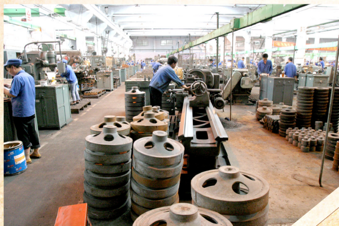
刚搬迁郑州厂房生产现场。

搬迁伊始,百废待兴。郑飞长达十几年的举债搬迁,债台高筑,严重拖累企业发展。迁郑后,科研生产经营上水平上台阶民心所向,而原来1个总厂4个分厂“小而全”的传统管理模式直接制约企业发展,体制机制改革刻不容缓。郑飞主动把握国家发展战略历史性机遇,实施政策性“分立破产”,优化机构、精干流程,初步搭建起现代企业架构雏形。