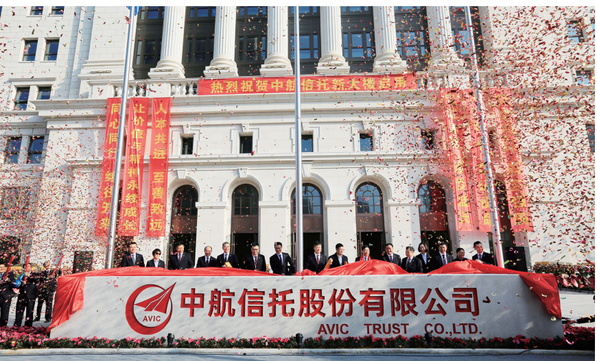
2020年1月8日，中航信托新总部——航信大厦启用。

十年历史，在奋斗中铭刻，美好未来，在奋进中开拓。中航信托将大力弘扬“航空报国”精神，担当航空强国使命，以转型发展为抓手，努力描绘第二增长曲线，致力于成为国家战略的实践者、绿色发展的推动者、共同富裕的倡导者。