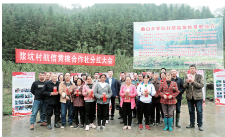
2020年10月，中航信托支持的扶贫产业“曲白乡茨坑村航信黄桃基地”举行分红仪式。

中航信托从“小切口”做好民生“大文章”。 预付类资金管理信托是信托服务本源优势的显著体现，能有效助力国家提升基层治理水平，维护消费者权益。2021年中航信托率先落地全国首单物业管理服务信托，推出双受托制房屋保障交易服务信托、社区基金会管理服务信托，创新采取共同受托人模式，与专业的场景服务商深度合作。根据委托人的意愿，开展财产保管、权益登记与分摊、支付结算、执行监督、清算、信息披露等专业化运营类金融服务，在保障资