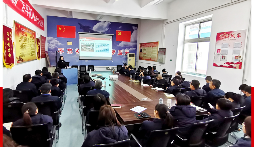
太航组织宣讲以《激活档案价值 助力数智太航》为主题的档案文化大讲堂，普及档案知识。