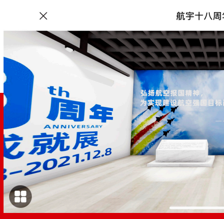
航宇十八周年发展成就展

护重要论述摘编》的学习结合起来，以高度的政治责任感和强烈的历史使命感，把我们党的历史、国家的历史、航空工业的历史守护好，这是航空工业档案工作者的政治责任和历史责任。