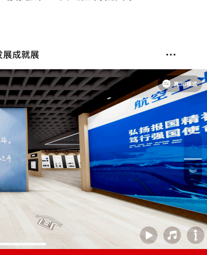
航宇十八周年发展成就展

征程万里风正劲，重任千钧再出发。航空工业档案系统将以此次座谈会为新起点，继续以习近平总书记对档案工作的重要批示精神为指引，提高思想认识，采取有力举措，推动学习贯彻重要批示精神的工作不断走深走实，按照集团公司的部署要求，抓住当前难得的发展机遇，守正创新、真抓实干，全面提升航空工业档案工作的质量和技术水平，以实际行动迎接党的二十大胜利召开。