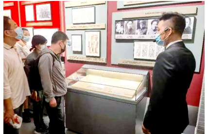
规划院党工融合参观第一历史档案馆。书记带头从“党史”和“档史”两条主线出发开展专题授课，强化管党“治档”的责任落实，实现双促进、双提升，同时，发挥了工会的桥梁和纽带作用，由档案部门与工会联合开展活动，进一步扩大学习人员的范围，强化单位员工档案法制意识，促进员工了解档

统一思想悟精神。 集团公司各单位纷纷通过党委中心组学习、档案部门学习等方式开展习近平总书记重要讲话精神相关文件的学习。例如，沈阳所、沈飞举办了专题党课，太航召