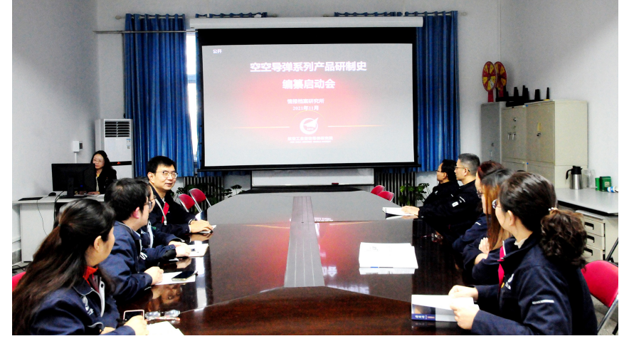
导弹院启动空空导弹研制史编纂工作。

技术创新提速度。 一年来，集团公司各单位按照习近平总书记对档案工作的目标要求，深刻领悟和把握“推动档案事业创新发展”的内涵，以档案管理技术创新为牵引，开启航空档案事业发展新局面。例如，沈阳所、沈飞、成都所、成飞、一飞院、西飞等单位作为“管数据”试点单位，着力推动三维数模归档研究、档案管理系统升级建设、档案工具升级等工作，确保档案工作能顺利开展。雷达所管理与技术并重，将档案技术、数据采