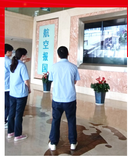
泛华职工观看以“喜迎二十大 航空档案颂辉煌”为主题的档案微电影展播。

集技术、数据管理技术纳入一级技术体系，以国家档案局和航空工业档案科研项目为依托，推动档案事业创新发展。南京机电档案馆开展“自身业务融入主价值链的思考与行动”和“更改贯彻落实跟踪流程信息化”项目。上电所融入主价值链，加强型号档案全生命周期管理，强化科研评审支持，提高工作效率，积极拓展档案信息服务，加强生产文件有效性控制，档案主管与生产现场定点联系。