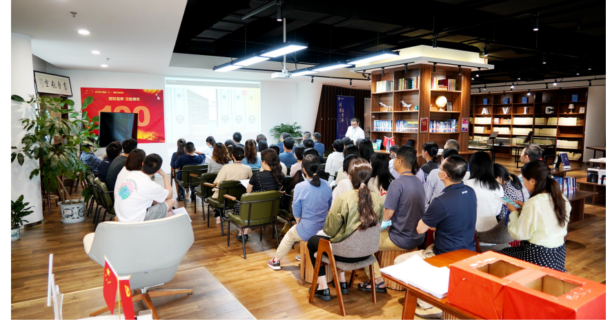
成都所开展档案宣传周活动，组织举办普法宣传和知识问答。