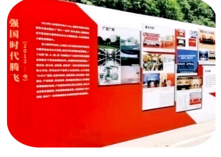
上电展出近200件档案文献和影像资料。

程万里风正劲，重任千钧再出发。航空工业档案系统将以此次座谈会为新起点，继续以习近平总书记对档案工作的重要批示精神为指引，提高思想认识，采取有力举措，推动学习贯彻重要批示精神的工作不断走深走实，按照集团公司的部署要求，抓住当前难得的发展机遇，守正创新、真抓实干，全面提升航空工业档案工作的质量和技术水平，以实际行动迎接党的二十大胜利召开。