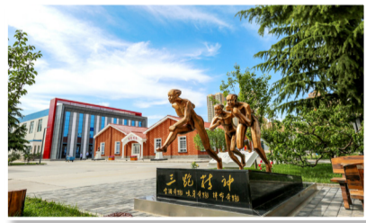
成有特色、有实力、有竞争力的现代一流企业，为建设新时代航空强国保驾护航，以优异的成绩迎接党的二十大胜利召开！