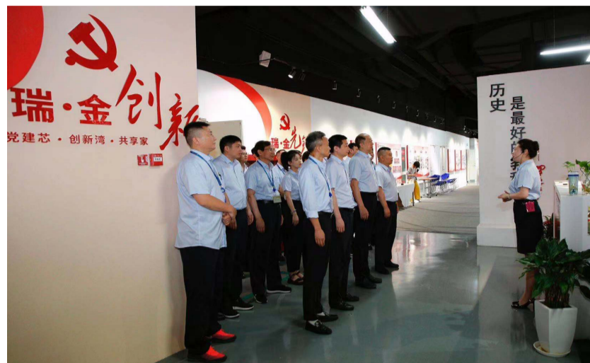
金城党委精心打造“瑞·金”百年伟业党史学习教育实景课堂。

新的一年，金城党委将贯彻落实习近平新时代中国特色社会主义思想，贯彻党的十九届六中全会精神、习近平总书记系列重要讲话精神，贯彻集团公司新时代航空强国发展战略，立足新发展阶段，贯彻新发展理念，坚持“航空为本、一体两翼、高质量发展”的总体发展思路，持续推动企业转型升级、高质量发展，以优异的成绩迎接党的二十大胜利召开。