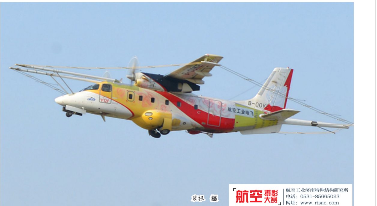
裴根 摄 航空工业西安航空控制科技有限公司

本报讯（通讯员 李宁浩 裴根）近日，由航空工业哈飞自主研发设计的固定翼时间域航空电磁系统飞行平台——运12F时间域飞机在平房机场成功首飞，标志着国家重点研发计划“固定翼时间域航空电磁测量技术系统研制”项目向前迈进了一大步，将有力推动我国航空地球物理探测事业的发展。 运12F时间域飞机是科技部立项的国家重点研发计划“深地资源开采”的组成部分，是“固定翼时间域航空电磁测量技术系统研制”项目中的四大核心课题之一。运12F时间域飞机以运12F第001架机为载体，针对高效、高精度的航空地球物理探测要求，进行了敷设发射线圈、加装时间域任务设备整机大规模改装工作。运12F时间域飞机全构型包括5匝线圈，用于电磁脉冲发射。10月10日，运12F时间域飞机完成挂载两匝线圈调整试飞，使项目又向前迈进一步。后续，哈飞将进一步开展调整试飞工作。5匝线圈调整试飞完成后，运12F时间域飞机将具备执行相关任务的能力。