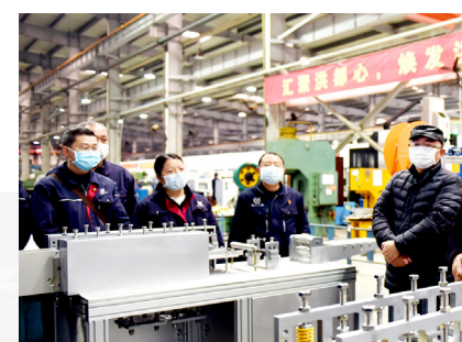
公司领导调研口罩机生产事宜。

精神纳入文化建设方方面面，持续解决好文化冲突和文化融合、文化传承和文化创新、文化规范布局和特色鲜明等问题，在洪都厚重的文化底蕴上涵养新的文化果实，不断引领和推动洪都公司转型发展，基业长青，助力洪都第三次创业征程和航空强国梦想的实现。