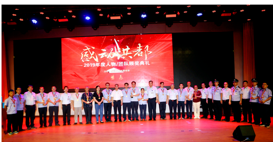
“感动洪都”颁奖仪式。

洪都公司文化建设领导小组认真学习习近平总书记关于文化和文化自信的重要论述，就如何承接集团“一心、两融、三力、五化”新发展战略、如何打造“先进文化力”、如何弘扬“航空报国”精神展开研讨，并在公司发起了一场“先进文化力”大讨论活动，下发《大力弘扬航空报国精神》通知，在对“航空报国”精神丰富内涵进行深入学习研讨的基础上，以李克强总理到洪都调研为契机，层层宣贯，激发全体员工报国热情。