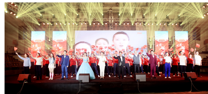
公司庆祝新中国成立70周年文艺晚会。

厂庆系列活动、“感动洪都”人物颁奖典礼、文艺晚会、职工运动会、航空科普教育暨“亲子开放日”活动、